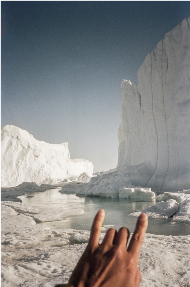
Inuuteq Storch, Soon Summer Will Be Over , 2023.