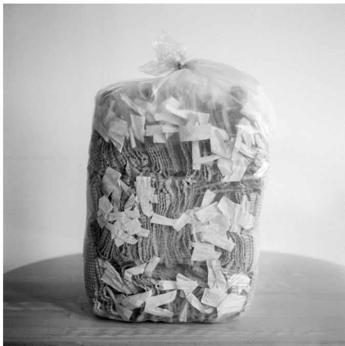
T.v. In the Past We Made History , t.h. The Memory of Salt